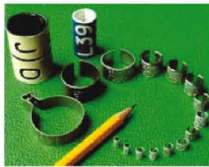
Farklı çaplarda halka örnekleri

*Ulusal halkalarımızdan bir örnek. Tüm halkalarda aynı adres yer almakta, kod numarası ise bireylere göre değişmektedir.